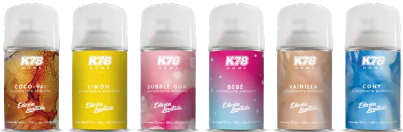
Coco-Vai Limón Bubble Gum Bebé Vainilla Cony