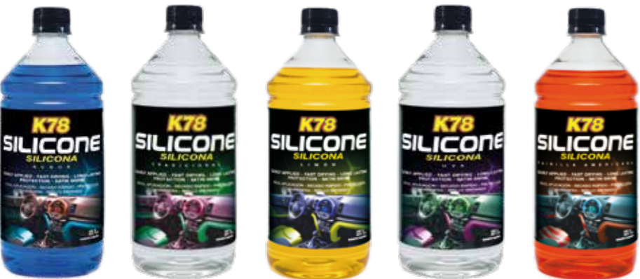
Acqua Tradicional Limón Uva Vainilla Americana

Caja Presentación: 24 Unidades 125ml. COD: 201