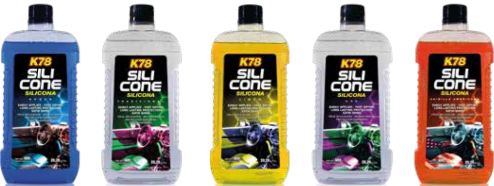
Acqua Tradicional Limón Uva Vainilla Americana