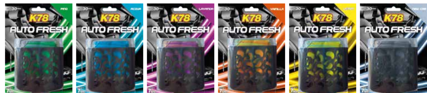
Pino Acqua Lavanda Vainilla Cítrico New Car