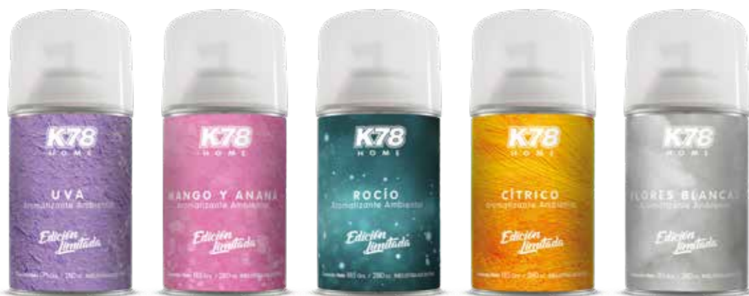
Uva Mango y Ananá Rocío Cítrico Flores Blancas