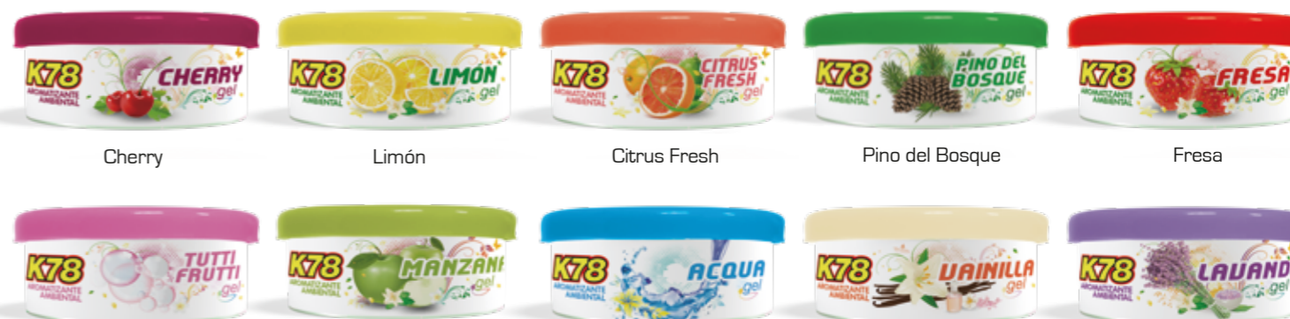
Cherry Limón Citrus Fresh Pino del Bosque Fresa Tutti Frutti Manzana Acqua Vainilla Lavanda