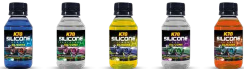
Acqua Tradicional Limón Uva Vainilla Americana

Ideal para: vinilo, goma y plástico Máxima duración