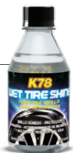
Caja Presentación: 15 Unidades 250ml. COD: 204