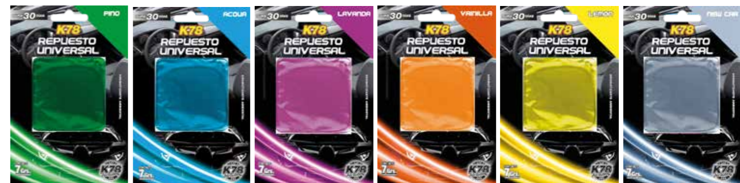
Pino Acqua Lavanda Vainilla Cítrico New Car