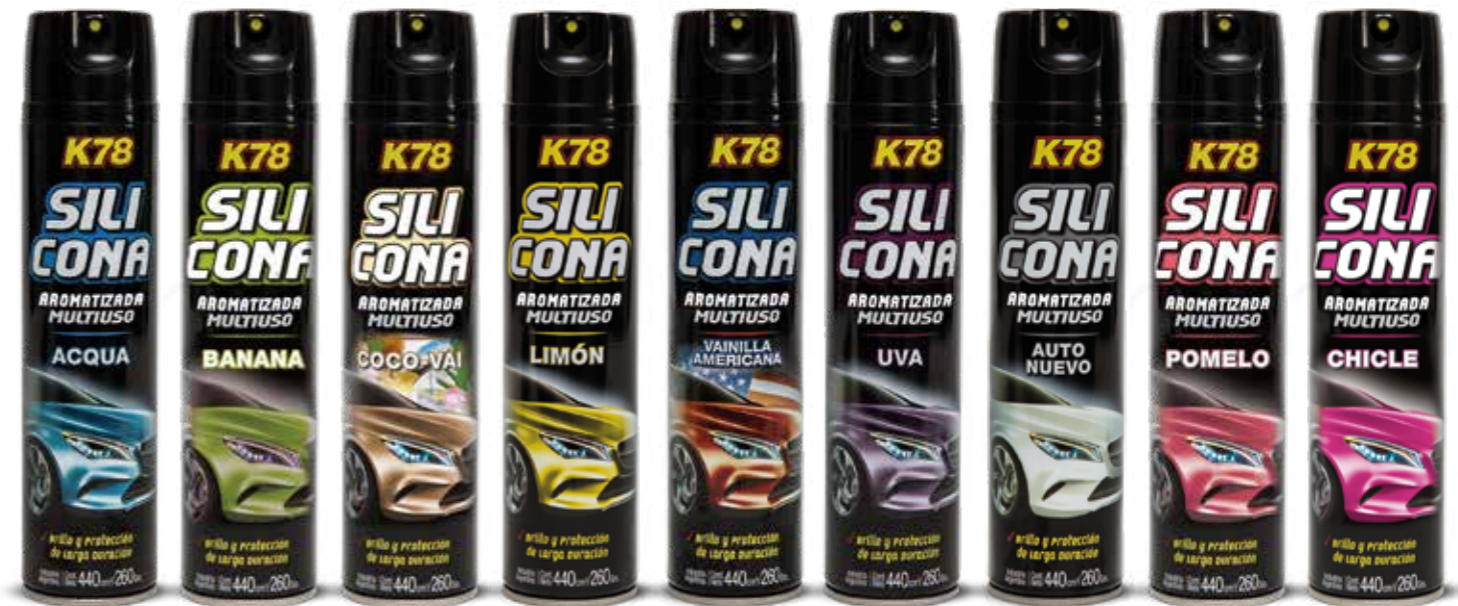
Acqua Banana Coco-Vai Limón Vainilla Americana Uva Auto Nuevo Pomelo Chicle