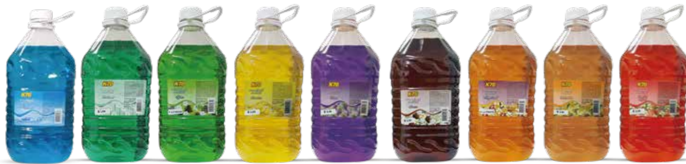
Acqua Brisas Spa Limón Uva Coco Tropical Vainilla Frutos Rojos