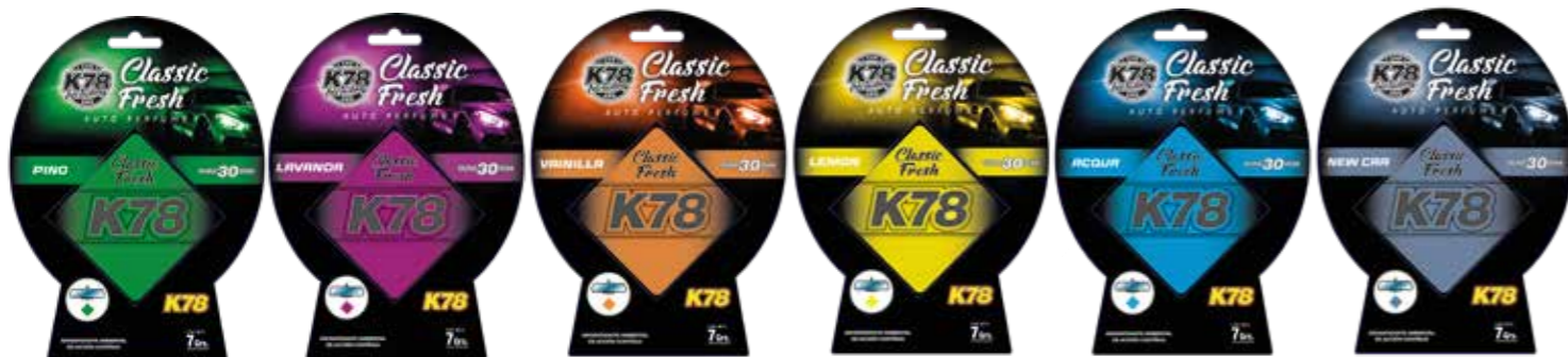
Pino Lavanda Vainilla Cítrico Acqua New Car