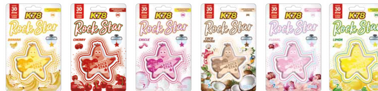
Banana Cherry Chicle Coco Hawaii Floral Limón