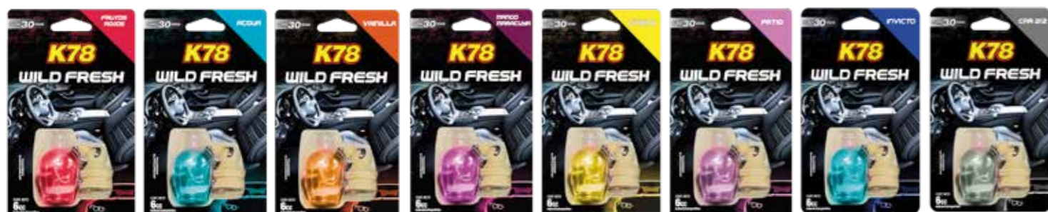
Frutos Rojos Acqua Vainilla Mango Maracuya Cítrico Patio Invicto Car 212