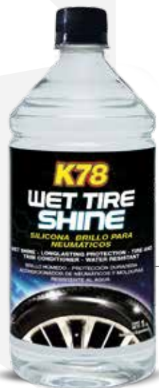
Caja Presentación: 15 Unidades 1Lt. COD: 206

Ideal para: neumáticos, plásticos, gomas, y vinilos.