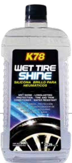
Caja Presentación: 15 Unidades 600ml. COD: 205